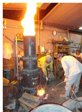
江田家の溶鋳炉(甑)